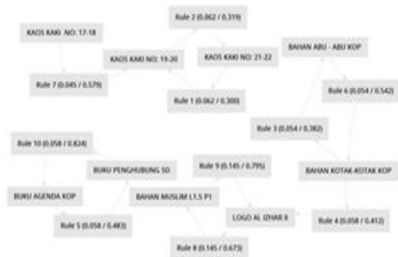
Gambar 3. Interpretasi Graph View